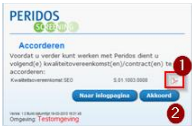
Figuur 1 – Bekijk de kwaliteitsovereenkomst en klik op 'Akkoord'

Gaat u akkoord met de kwaliteitsovereenkomst(en), dan klikt u op de knop 'Akkoord'. Bent u niet akkoord met de kwaliteitsovereenkomst(en), dan kunt u niet verder inloggen. Neemt u in dat geval contact op met uw Regionaal Centrum.