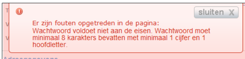
Figuur 5 – De wijzigingen kunnen niet opgeslagen worden

Indien op het scherm enkele gegevens niet of onjuist ingevoerd zijn, verschijnt tevens hiervan een melding. U kunt de betreffende gegevens aanpassen en alsnog opslaan.