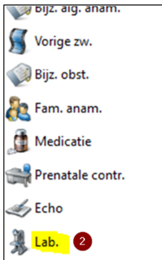
Figuur 3. Vrumun Windows client