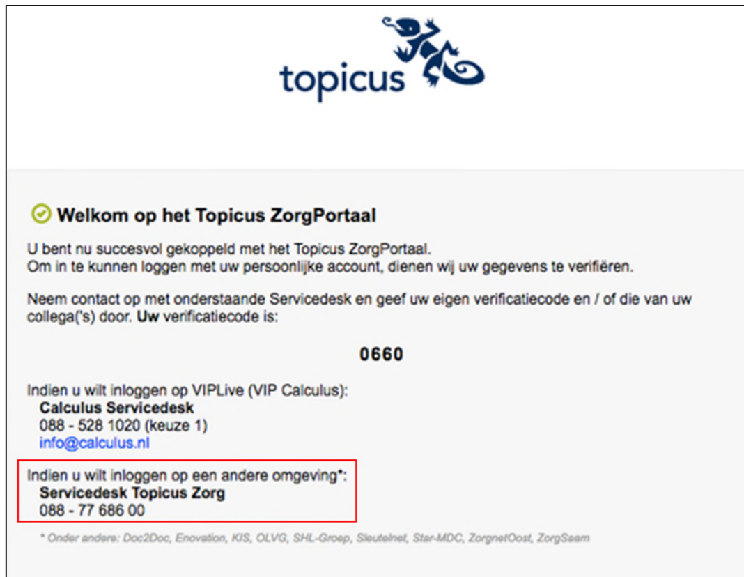
Figuur 5. Zorgportaal verificatiecode

Let op: het is ook mogelijk dat één medewerker van een zorginstelling voor alle medewerkers de verificatiecodes verzamelt en doorbelt. Het is dan van belang dat bijgehouden wordt welke medewerker welke verificatiecode heeft verkregen. Deze codes kunt u dan samen met de datum en tijd waarop deze op het scherm is verschenen noteren. De datum en tijd zijn nodig in het telefonische contact met de Zorgportaal Servicedesk.