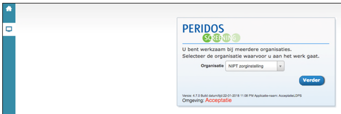
Figuur 6. Peridos keuzescreen voor de zorginstelling