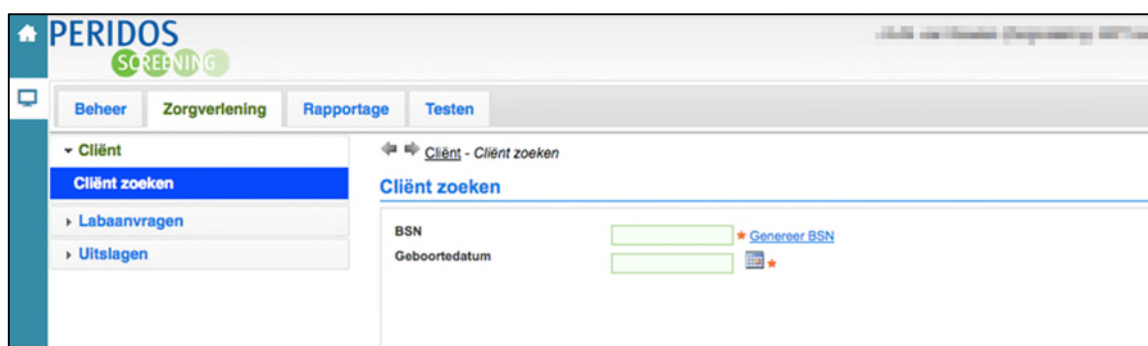
Figuur 7. Openings scherm Peridos