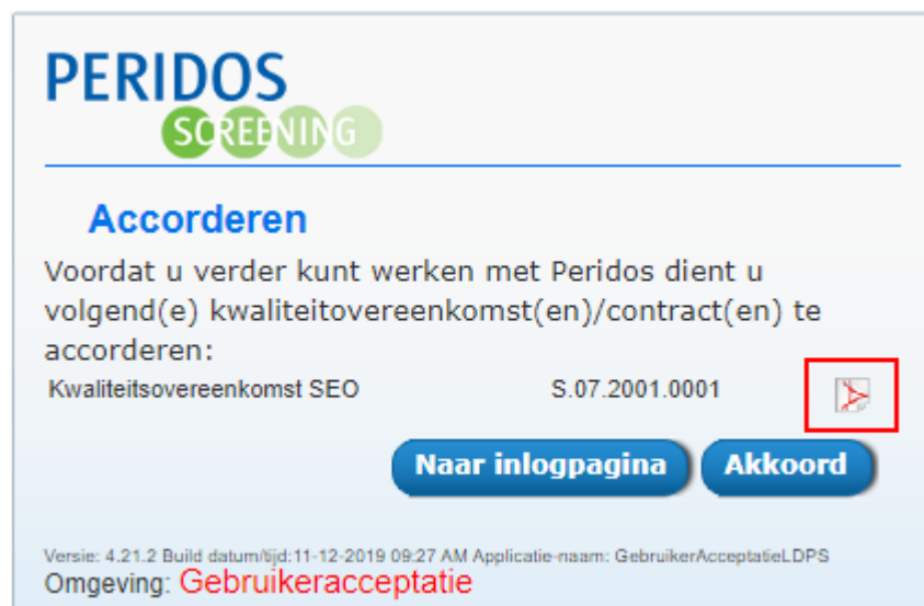
Figuur 1 – Bekijk de kwaliteitsovereenkomst en klik op 'Akkoord'

Gaat u akkoord met de kwaliteitsovereenkomst(en), dan klikt u op de knop 'Akkoord'. Bent u niet akkoord met de kwaliteitsovereenkomst(en), dan kunt u niet verder inloggen. Neemt u in dat geval contact op met uw Regionaal Centrum.